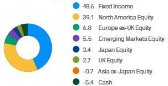
Current positioning (%)

JPMorgan Investment Funds – Global Balanced Fund class: JPM Global Balanced C (acc) USD (hedged)