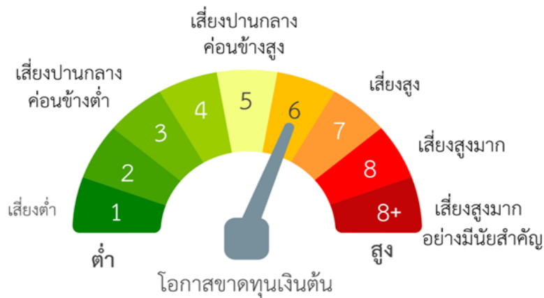
แผนภาพแสดงตำแหน่งความเสี่ยงของนโยบายการลงทุน

ความเสี่ยงของนโยบายการลงทุน อาจเกิดขึ้นได้จาก ■ ความเสี่ยงจากความผันผวนของมูลค่าหน่วยลงทุน (Market Risk) ■ ความเสี่ยงจากความสามารถในการชำระหนี้ของผู้ออกตราสารหนี้ (Credit Risk) ■ ความเสี่ยงจากการดำเนินธุรกิจของผู้ออกตราสาร (Business Risk) ■ ความเสี่ยงจากการขาดสภาพคล่องของหลักทรัพย์ (Liquidity Risk) ■ ความเสี่ยงจากการลงทุนกระจุกตัว (High Concentration Risk) (สามารถอ่านคำอธิบายเพิ่มเติมได้จากทำยรายงานฉบับนี้)