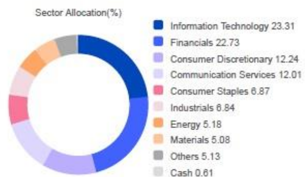
United Asia Fund

■ หน่วยลงทุนของกองทุน 97.45 % ■ อื่น ๆ 2.55 %