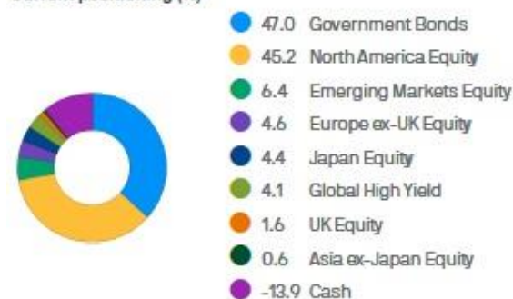
Current positioning (%)

JPMorgan Investment Funds – Global Balanced Fund class: JPM Global Balanced C (acc) USD (hedged)